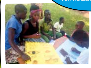
Die Kinder lernen nicht nur miteinander, sondern vor allem auch voneinander.

Bildung ist das Beste, was wir den Kindern und Jugendlichen für ihre Zukunft mitgeben können. VON HERZEN DANKESCHÖN!